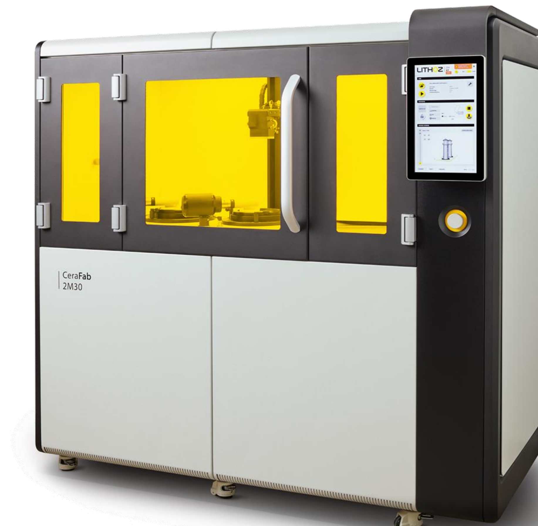
CeraFab Multi 2M30, Lithoz GmbH